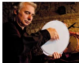
Spectacle accueilli en collaboration avec le Guingois, scène de musiques actuelles montluçonnaise